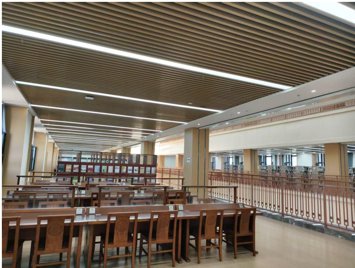
图 1-1 期刊阅览室实拍图