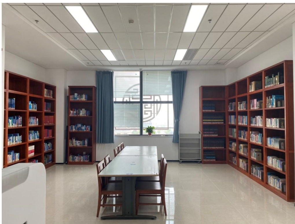
图 2-1 工具书阅览室实拍图